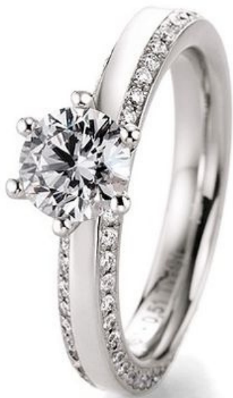
Solitaire Ring "Schmuckes Statement" mit Krapfen- und Verschnitt-Fassung. 105 funkelnde Brillanten total 1,52ct.