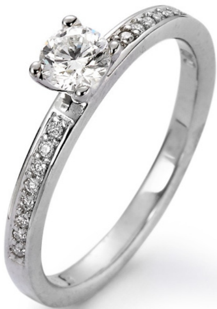
Bestellnummer: 558229 Material: 18 Karat Weissgold 17 Diamante: 0.40 ct Wsi Preis CHF 2980.-